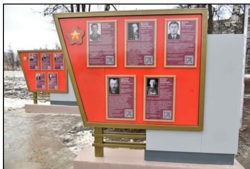
Стенд с информацией о полных кавалерах ордена Славы в Парке Победы (Йошкар-Ола)