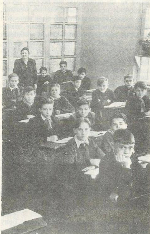
5-й «Е» класс 186-й мужской средней школы, 1949 год.

«КЖ»: Все знавшие Высоцкого обычно характеризуют его как человека очень коммуникабельного, легко сходявшегося с людьми и ориентировавшегося в любой обстановке. А тут вдруг: «как цыпленок»?